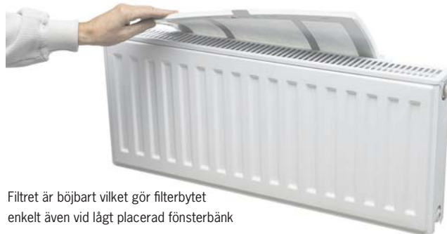
Filtret är böjbart vilket gör filterbytet enkelt även vid lågt placerad fönsterbänk