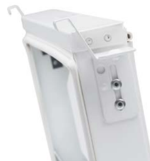
Luftdon med renslucka