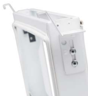
Luftdon utan renslucka