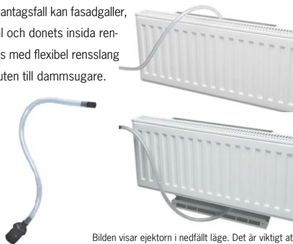
Bilden visar ejektorn i nedfällt läge. Det är viktigt att ejektorn efter rensning viks upp till uppfällt läge

Easy-Vent kan vid behov torkas av med lätt fuktad trasa. Förutom regelbundna filterbyten krävs normalt ingen ytterligare rengöring. I undantagsfall kan fasadgaller, kanal och donets insida rengöras med flexibel rensslång ansluten till dammsugare.