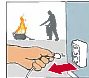
Brand i elektrisk utrustning. Dra ur kontakten innan du försöker släcka. Har du en pulversläckare kan du släcka direkt.