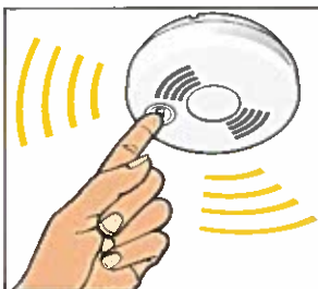
Testa brandvarnaren varje månad genom att trycka på testknappen.