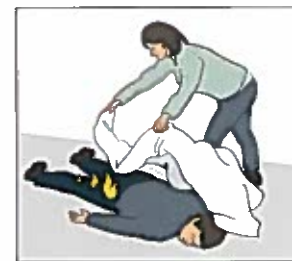
Brand i kläder. Försök få ner personen liggande. Kväv elden med en brandfilt eller vad som finns tillhands. Släck från huvudet och nedåt.