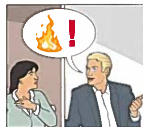
Rädda och varna andra som kan befinna sig i fara.

Rädda – Varna – Larma – Släck är normalt den ordning du kan följa om du upptäcker en brand. Men den verkliga situationen avgör vilken ordning som är bäst. Är ni flera kan ni hjälpas åt.