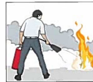
Släck branden om du bedömer att du klarar det.