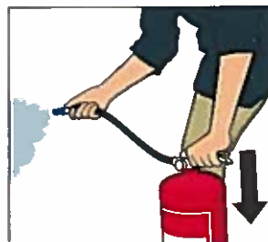
Tryck ner handtaget.