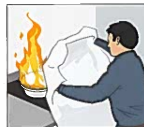
Brand i kastrull. Lägg på locket eller en brandfilt för att kväva branden. Använd aldrig vatten. Vatten får branden att spridas.