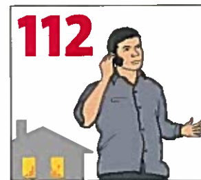
Ring 112 – berätta vad som har hänt och om någon är skadad, var hjälpen behövs och vem du är som ringer.