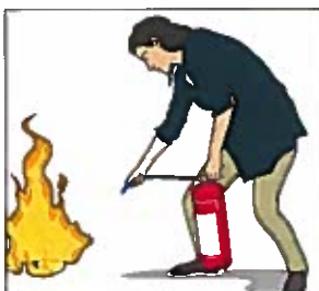
Rikta mot lågornas bas.