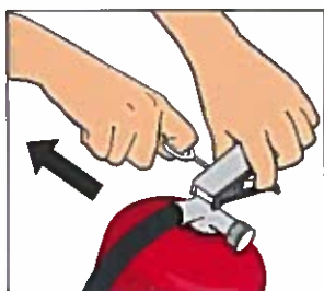
Dra ut säkringen.